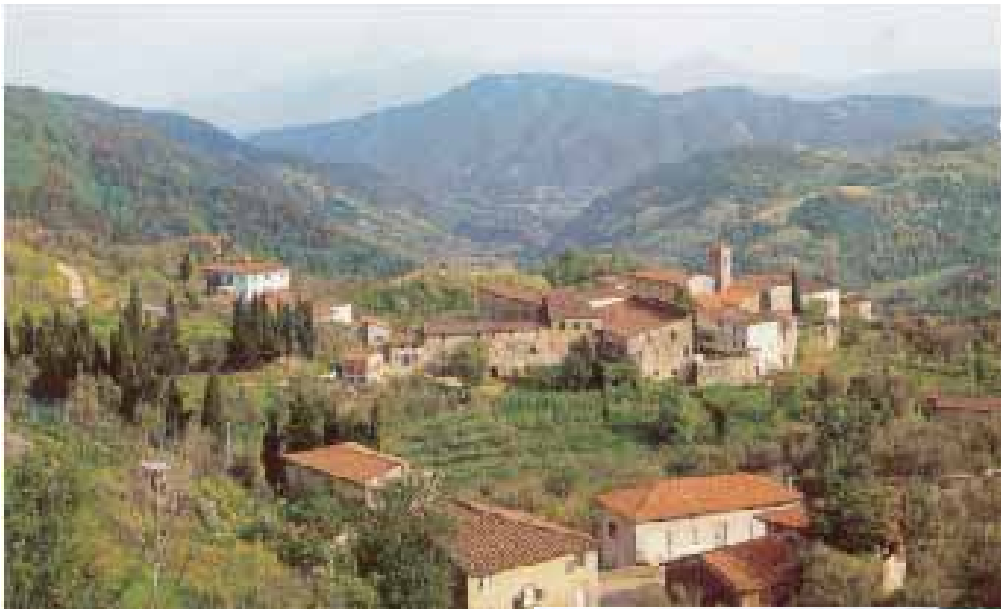
Loppeggia med omegn