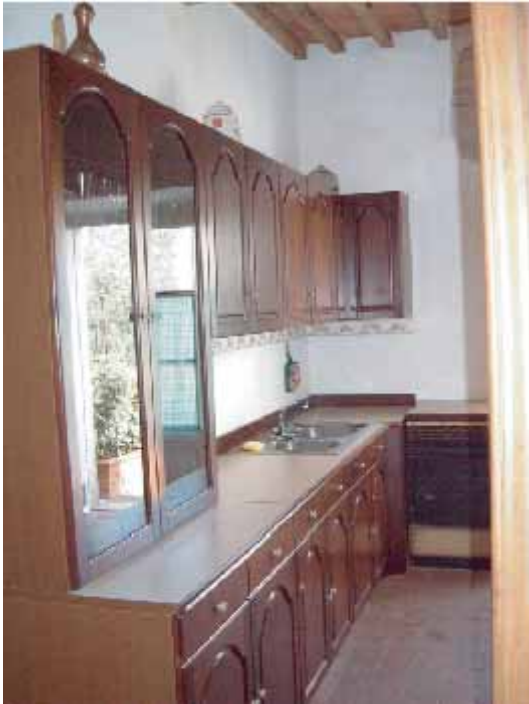
Kjøkken med utgang til terrasse