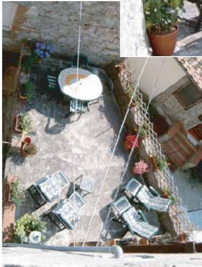
Terasse og inngang til cantina (kjelleretg.)