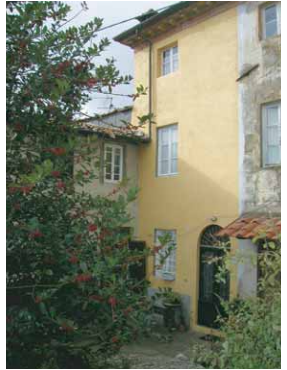
Inngangsparti med forhave

1. klasses restaurant nabohus. 50 m. til kaffebar. Kolonial, grønnsaksbutikk og slakter er i umiddelbar nærhet