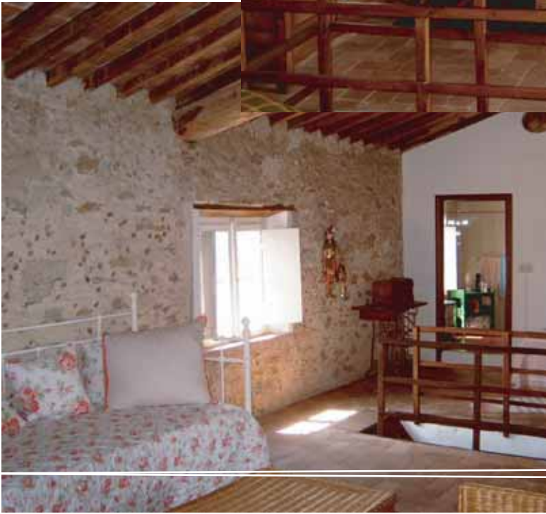
Kombinert loftstue / soveværelse