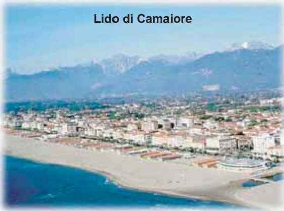
Lido di Camaiore