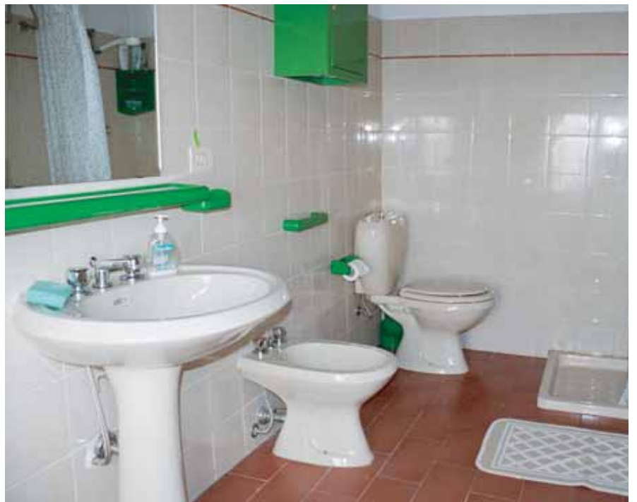
Bad /dusj 3 etg