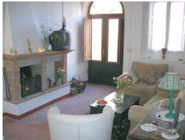
Stue i 1. etg